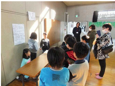
3年 総合的な学習発表会