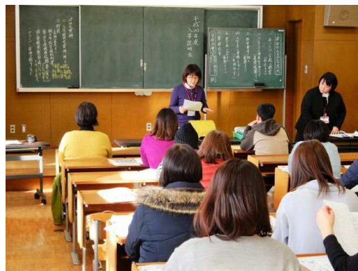
<1年生の担当より説明>

新入学児童は、現在36名が入学する予定です。4月9日に元気に入學してくることを楽しみにしています。